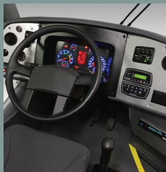
Panel Multiplex Multiplex Panel

Efficient and versatile solution for the tourism and charter sector, Ideale is now circulating with wider structure and a body with modernized design. Innovations which, combined to the good model performance and to the low maintenance cost, provide comfort and safety to the user and offer excellent cost/benefit to the charter operator in lines with short and medium distances.