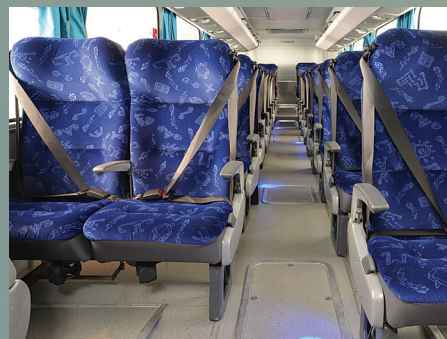
Asiento Ejecutiva 1005 - (más espacio, confort y privacidad) Executive seat 1005 - (more space, comfort and privacy)