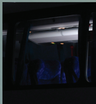
Maletero con iluminación en LED Luggage rack with LED lighting