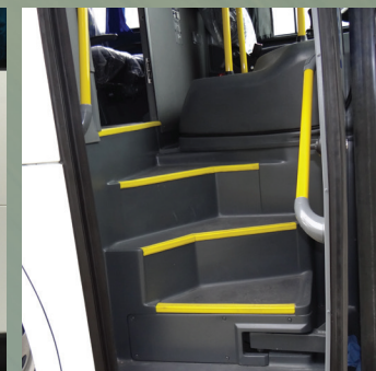
Porta In Swing 870mm - fácil acceso al salón In Swing door 870mm - easy access to the salon