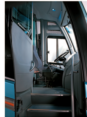
Nueva cabina para el conductor con la entrada más amplia y segura.

Chasis disponibles y layouts de distribución de butacas bajo consulta.