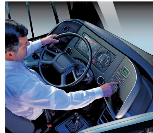
Nuevo múltiplex y tablero con satélites laterales retráctiles: mayor ergonomía, seguridad y dirección.