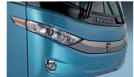
Indicador de dirección con LEDs, conjunto óptico con diseño arrojado y con un nuevo farol de neblina que amplían la seguridad.