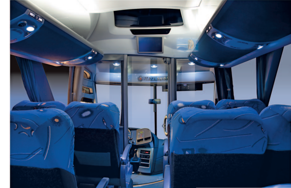
Interior con nueva dimensión en confort, acústica y climatización.